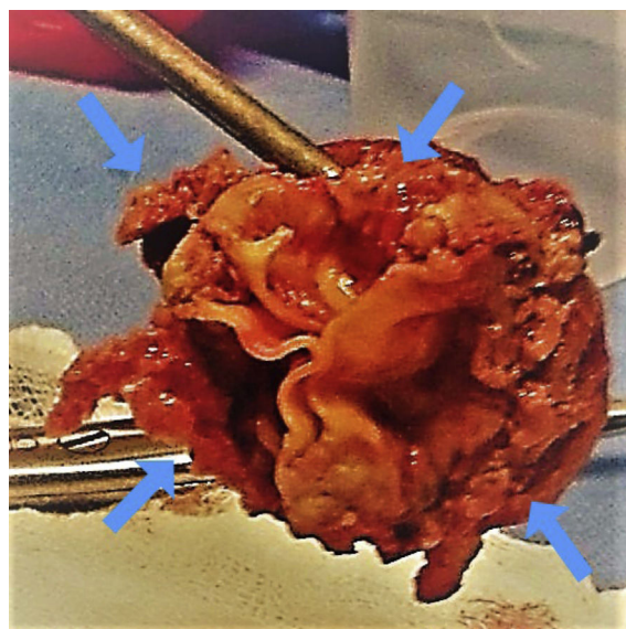
Figura 2 Peça cirúrgica de prótese valvar biológica mitral. Face ventricular esquerda. Setas: Vegetações friáveis aderidas aos três folhetos valvares.